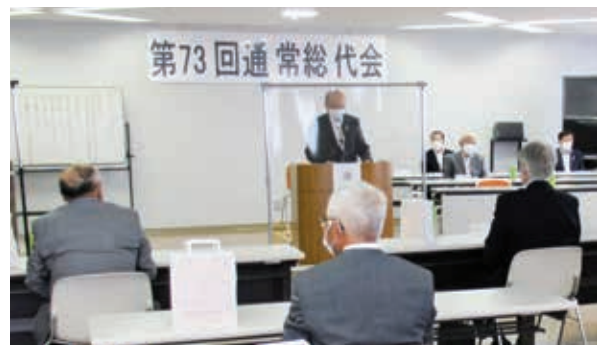
第73回通常総代会の様子