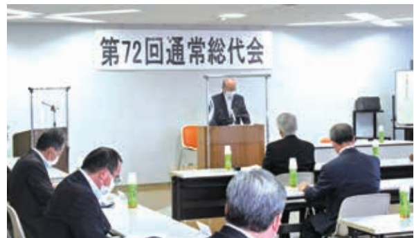
第72回通常総代会の様子