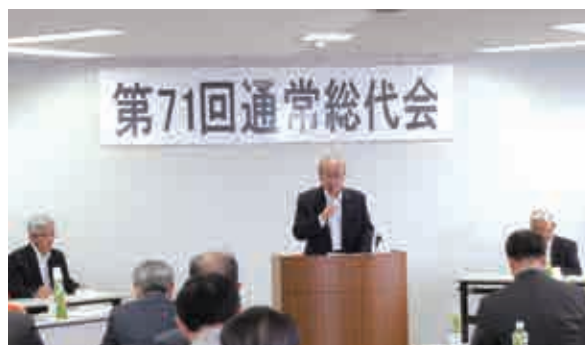
第71回通常総代会の様子